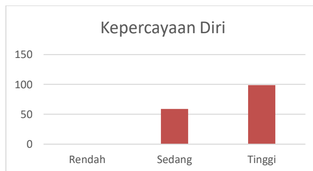
Grafik 2. Data Kepercayaan Diri

Berdasarkan grafik 1. Terlihat bahwa dari 158 peserta didik kelas VIII di SMPN 8 Yogyakarta di dapat sebanyak 100 peserta didik berada pada kategori tinggi, 58 peserta didik berada pada kategori sedang, dan tidak terdapat peserta didik yang berada pada kategori rendah. Hal tersebut juga terjadi dengan analisis kepercayaan diri. Sebagian besar sedangkan pada analisis data kepercayaan diri di dapat data 99 peserta didik berada pada kategori tinggi, 59 peserta didik berada pada kategori sedang, dan tidak terdapat peserta didik yang berada pada kategori rendah.